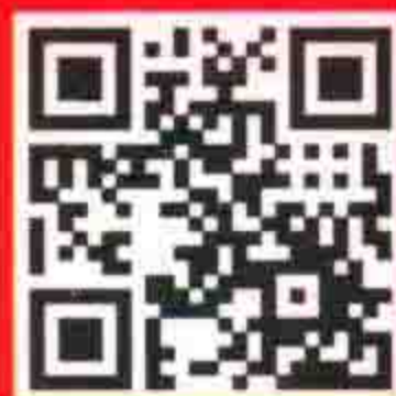
人民日报出版社 官方淘宝店铺