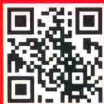
人民日报出版社 官方微博平台